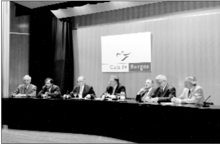
Presencia de autoridades en la presentación del Ciclo de Conferencias

lógico Edelweiss y los estudios del Karst de Atapuerca".