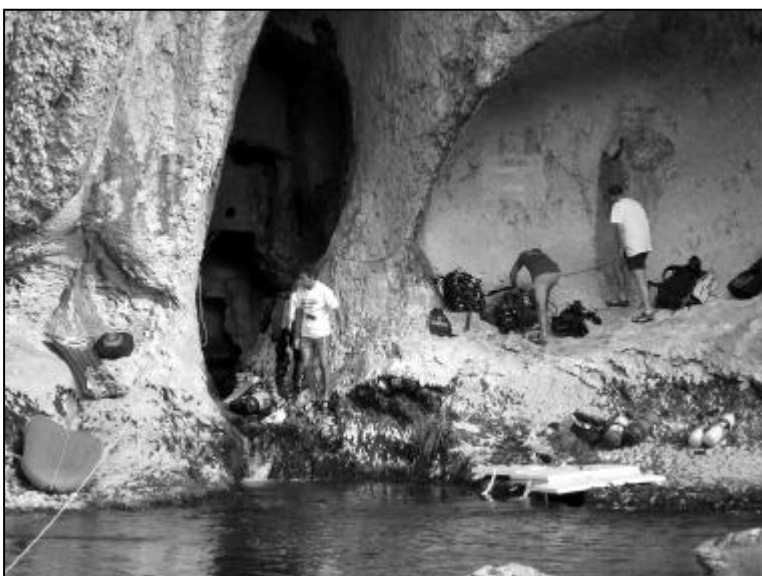
Preparativos en la entrada a la cavidad

Después de unas reuniones consolidamos un pequeño equipo