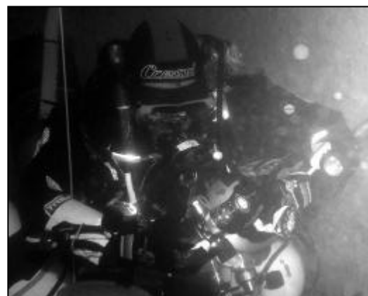
M. Burgui (-60 m.)