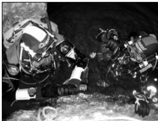
M. Burgui y O. Carrión en la pileta de entrada