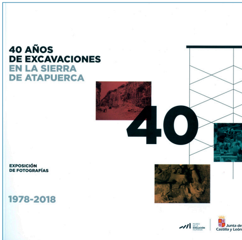
Portada del catálogo de la exposición del Museo de la Evolución Humana '40 años de excavaciones en la Sierra de Atapuerca'.