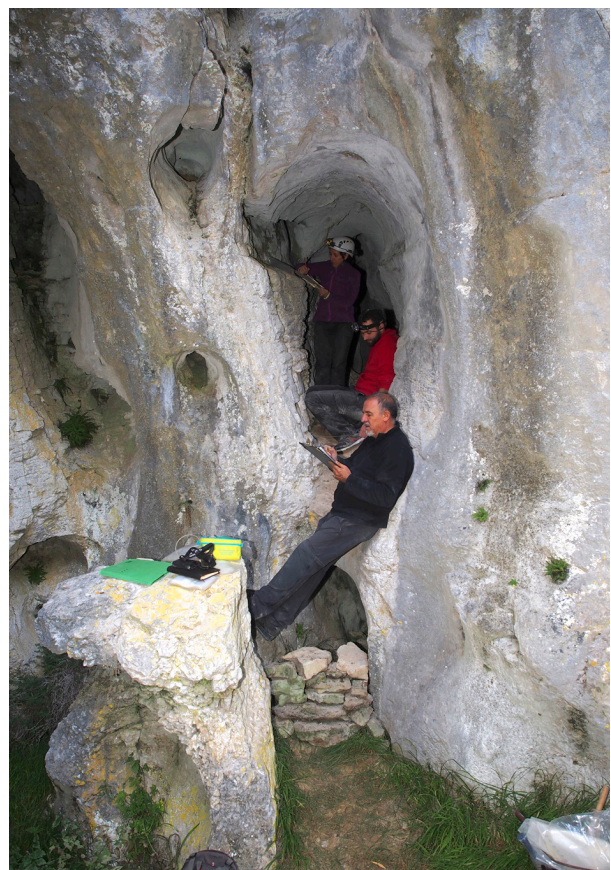
Intervención arqueológica en la galería sepulcral de Covanera.

Se colaboró en la excavación arqueológica de Covanera, dirigida por Ana Isabel Ortega, en cuya galería sepulcral habíamos detectado el año pasado el expolio parcial de sus restos. Aparecen numerosos restos humanos, especialmente de niños y abundantes cuencos cerámicos. Se hizo el escaneo en 3D de toda la cavidad y se prospectaron superficialmente otras laterales en las que también aparecen restos diversos. Durante la campaña se dieron dos charlas en el C.P. Santa Cecilia de Espinosa de los Monteros, una enfocada a los alumnos de infantil y otra a los de primaria, y se atendieron diferentes visitas, entre ellas las de los profesores del centro. También