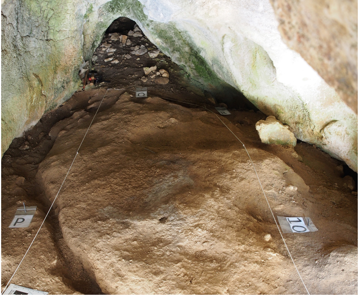
Comienzo de la excavación de Cueva Fantasma en el tramo que conserva el techo original.