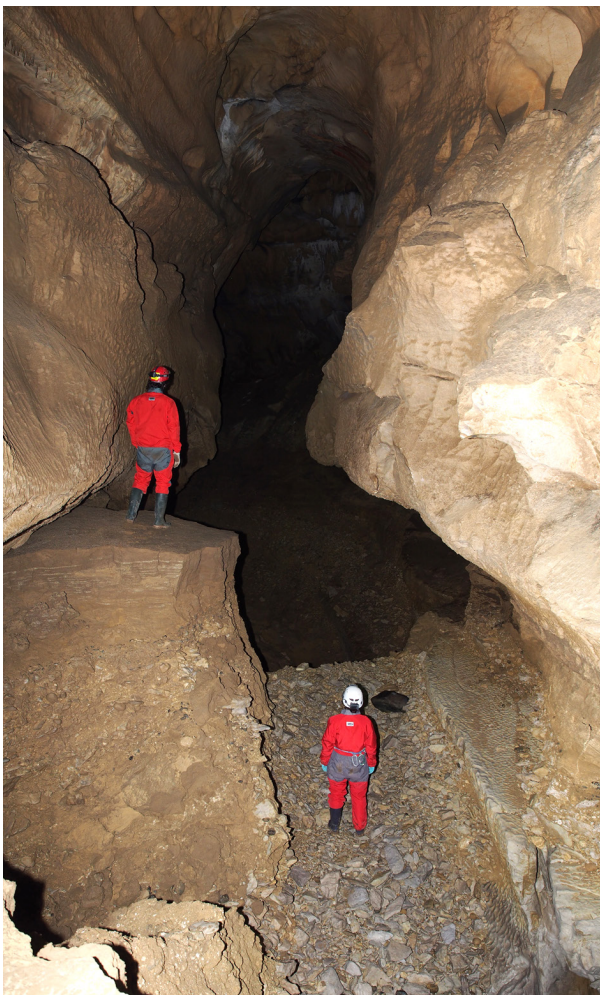
La reexcavación de sedimentos alcanzó, en 2018, la Sala del Cacique.

En el Dédalo Oeste también se dedicaron tres salidas a revisar las galerías del sexto nivel localizadas aguas abajo de la Sala Guipúzcoa, detectando que había desaparecido la obstrucción sedimentaria provocada por las grandes riadas de años anteriores. Apareció, tras una pequeña escalada, una galería de unos 150 metros que fue topografiada. Previamente se había comprobado que, por el contrario, la reexcavación de la Galería del Cacique ya ha progresado justo hasta la Sala del Cacique, concretamente hasta el punto en que llegan las visitas turísticas.