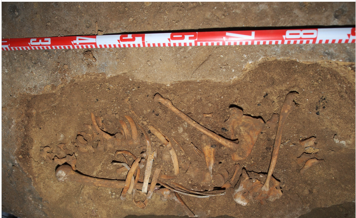
Enterramiento del nivel superior de la Sima Dolencias excavado en 2018.

de otros restos arqueológicos. Se escaneó el yacimiento y todo el contexto de la Sima Dolencias por nuestro compañero Alfonso Benito, geomorfolo del CENIEH.