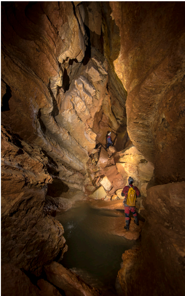
Interior de la Sima del Portillo de Hontoria del Pinar.

El día 4 de septiembre se inauguró el Centro de Visitantes del Geoparque de Las Loras de Villadiego, en cuya segunda planta se ha ubicado nuestra exposición itinerante Cuevas y paisajes kársticos, una historia escrita con agua , coproducida en 2011 con el Aula de Medio Ambiente Caja de Burgos. Acordamos con la Asociación Argeol que en 2019 inicie un recorrido itinerante por los diferentes municipios de la comarca.