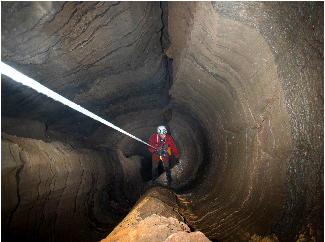
Descenso hacia el colector del Sistema de la Cubada.