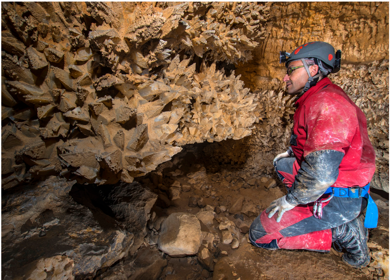
El Meandro de los Cristales del Sistema de la Cubada.