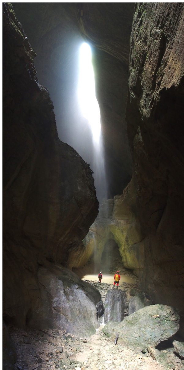
La cascada de la Sima Dolencias iluminada por la luz natural en junio de 2018.

Accedimos al Sector Dulla, recorriendo las principales galerías que se desarrollan al sur de la Sala de las Terrazas, comentando las principales opciones de continuidad en algunas escaladas que conviene revisar, o en posibles desobstrucciones. Apareció un hueso fosilizado, en una terraza, al final de la Galería del Beso, que probablemente implique una nueva entrada, tal vez colmatada, desde el Páramo de Villamartín hacia la red principal.