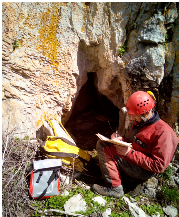
Topografiando una de las nuevas cavidades de los Montes de la Peña.

En la ya citada exposición itinerante Investigaciones Arqueológicas en la Provincia de Burgos 2017 , otro