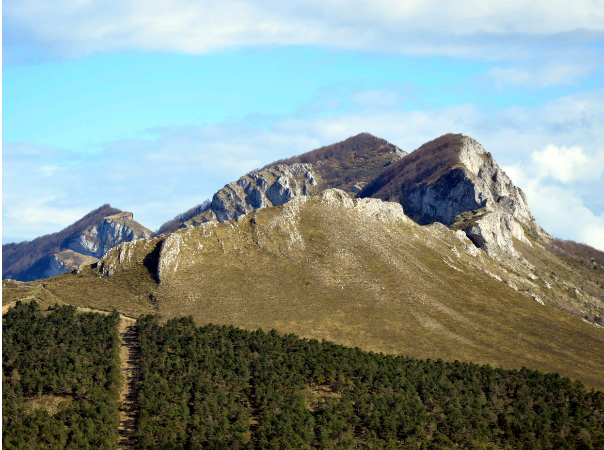
Sector central de los Montes de la Peña.

salidas a la misma. Se trata de una de las zonas con mayor potencial de la provincia de Burgos, desarrollada en las mismas calizas coniacienses que Ojo Guareña y Sierra Salvada y cuyo nivel de base viene marcado por la impresionante surgencia del río Cadagua. A lo largo de los años son muchos los grupos espeleológicos, incluido el propio GEE, que han estado por la zona pero en ningún caso se originó un trabajo sistemático de prospección y topografía del conjunto que fuera plasmado en una publicación, ni tan siquiera de forma somera. Entre las cavidades más notables, aparte del propio conjunto surgente del Cadagua, destacan la Cueva de los Moros o de Santa Marina, la Sima de la Grajera, la Cueva de Umarraña, la Cueva del Aguasal o la Sima del Sifón.