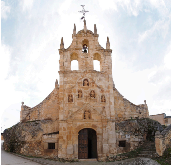
Cueva ermita de Hontangas.

» Diario de Burgos del 23/03/18, pg. 75: “ Conferencias en la Diputación ”.