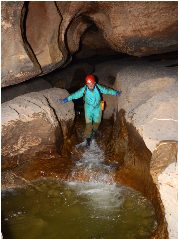
El río Guareña, en estiaje, discurriendo por el sexto nivel.