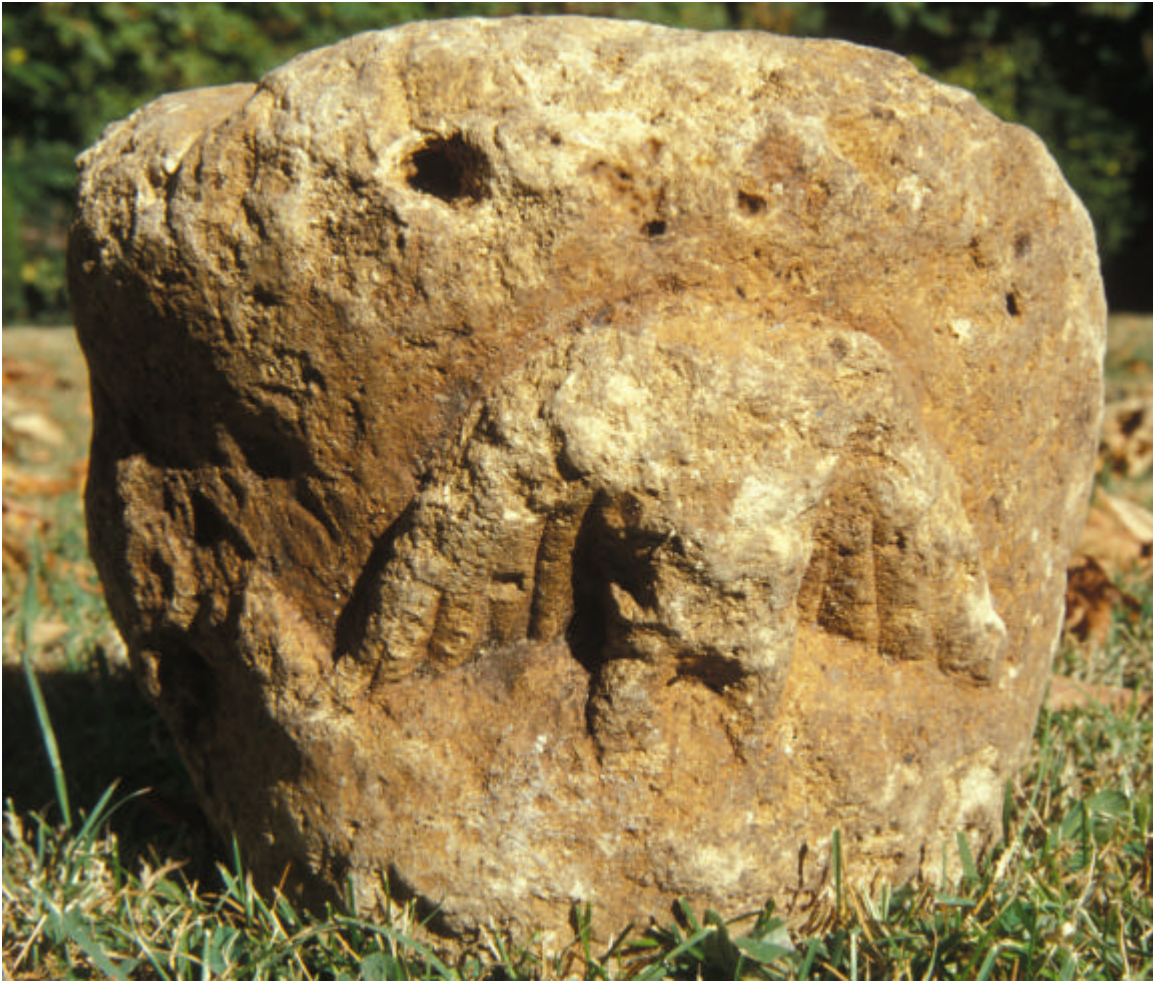
Vista del capitel románico con dos figuras zoomorfas (posiblemente águilas), procedente del interior del sumidero de Fuente Santiago (Monte Santiago Nancláriz, Berberana, Burgos)