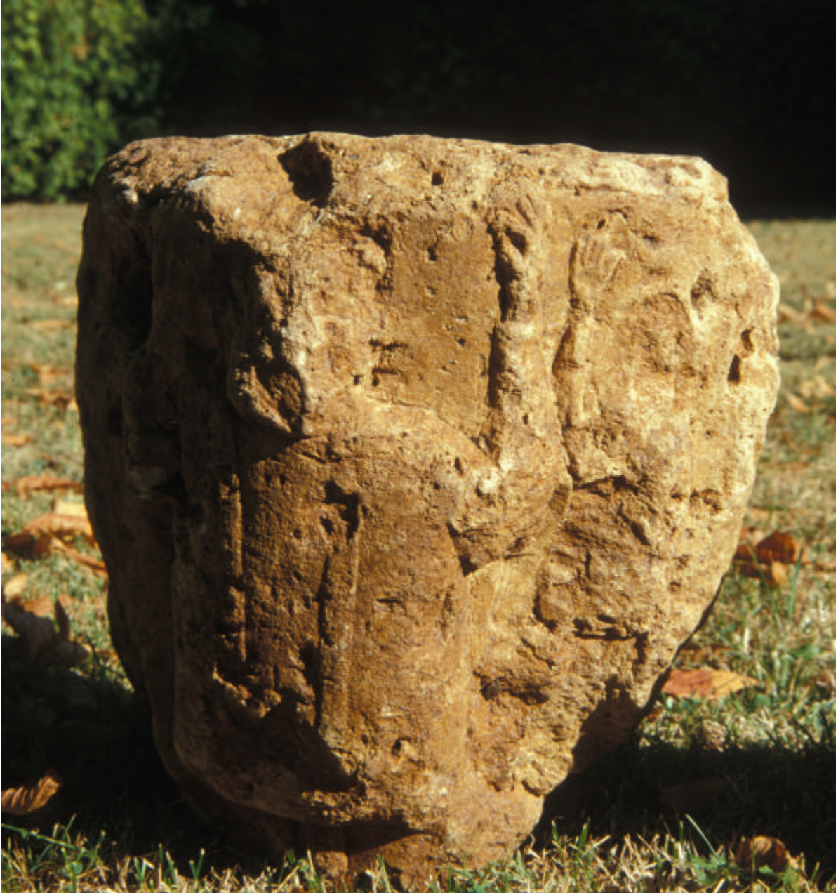
Vista del capitel románico con dos figuras antropomorfas, procedente del interior del sumidero de Fuente Santiago (Monte Santiago Nancláriz, Berberana, Burgos)