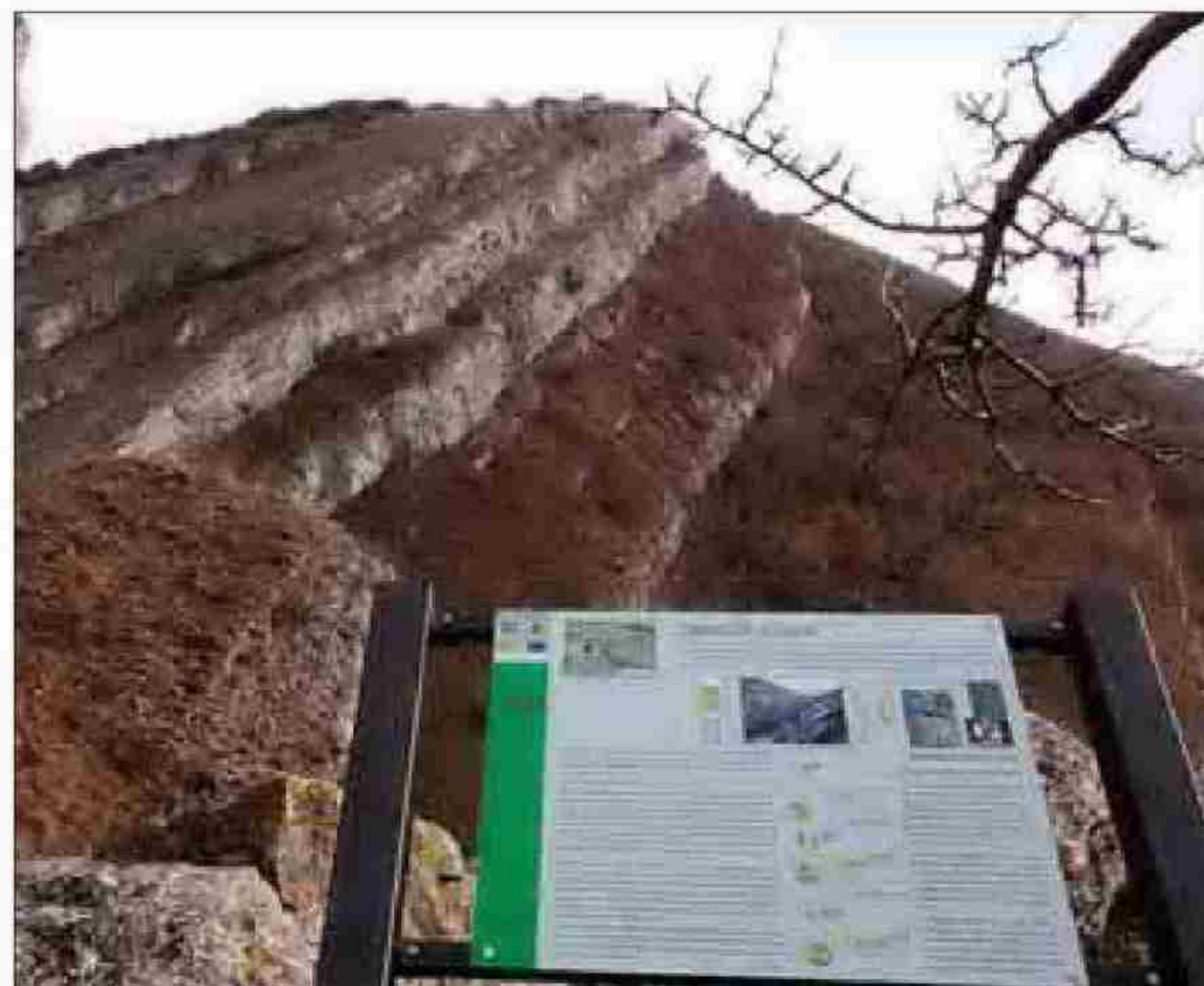
La señalización geológica se encuentra en lugares clave del camino.