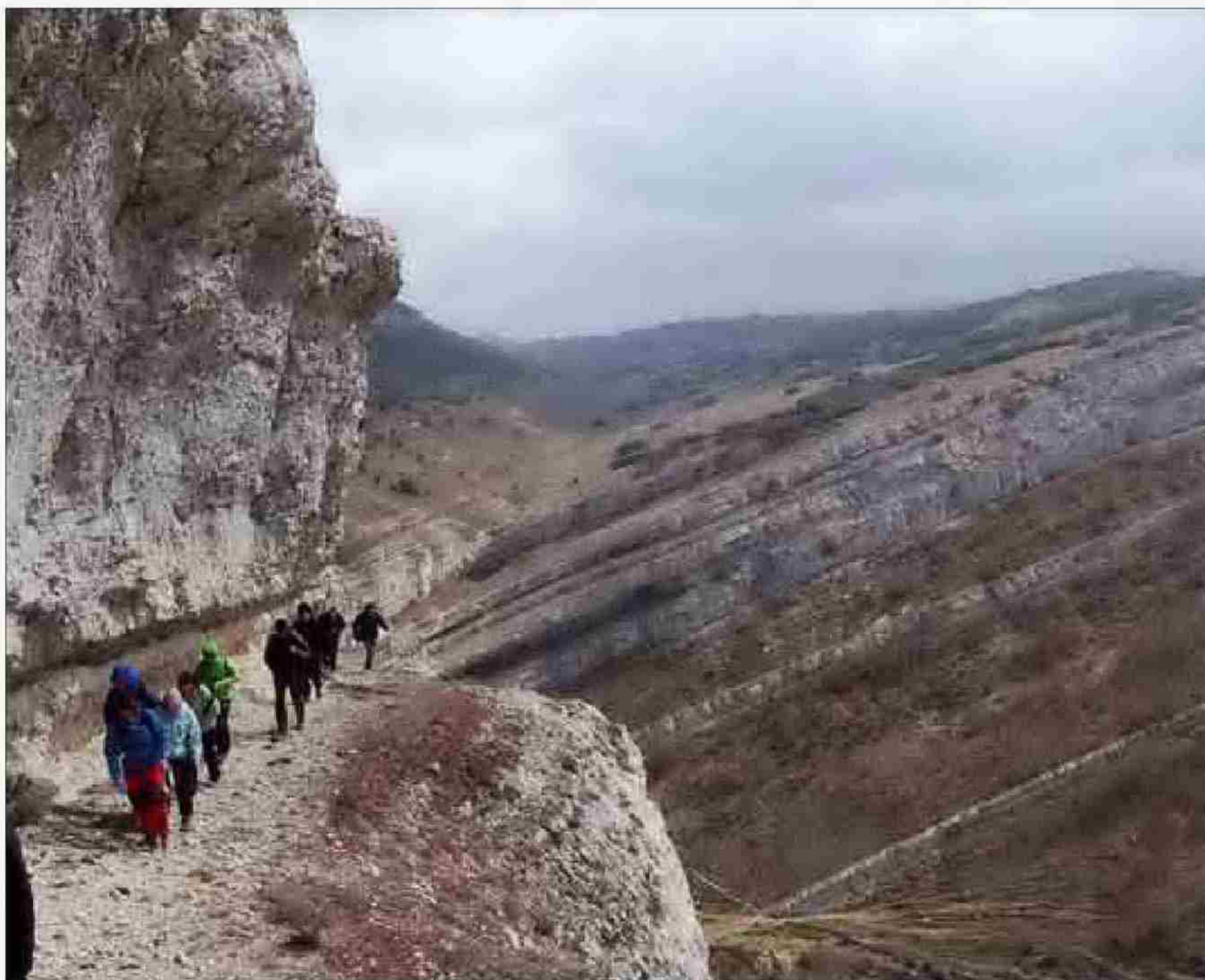
El recorrido tiene lugares de gran poder paisajístico.

El camino sube así por el cierre y va bordeando la roca para volver a Rebolledo de la Torre, con unos cuantos paneles explicati-