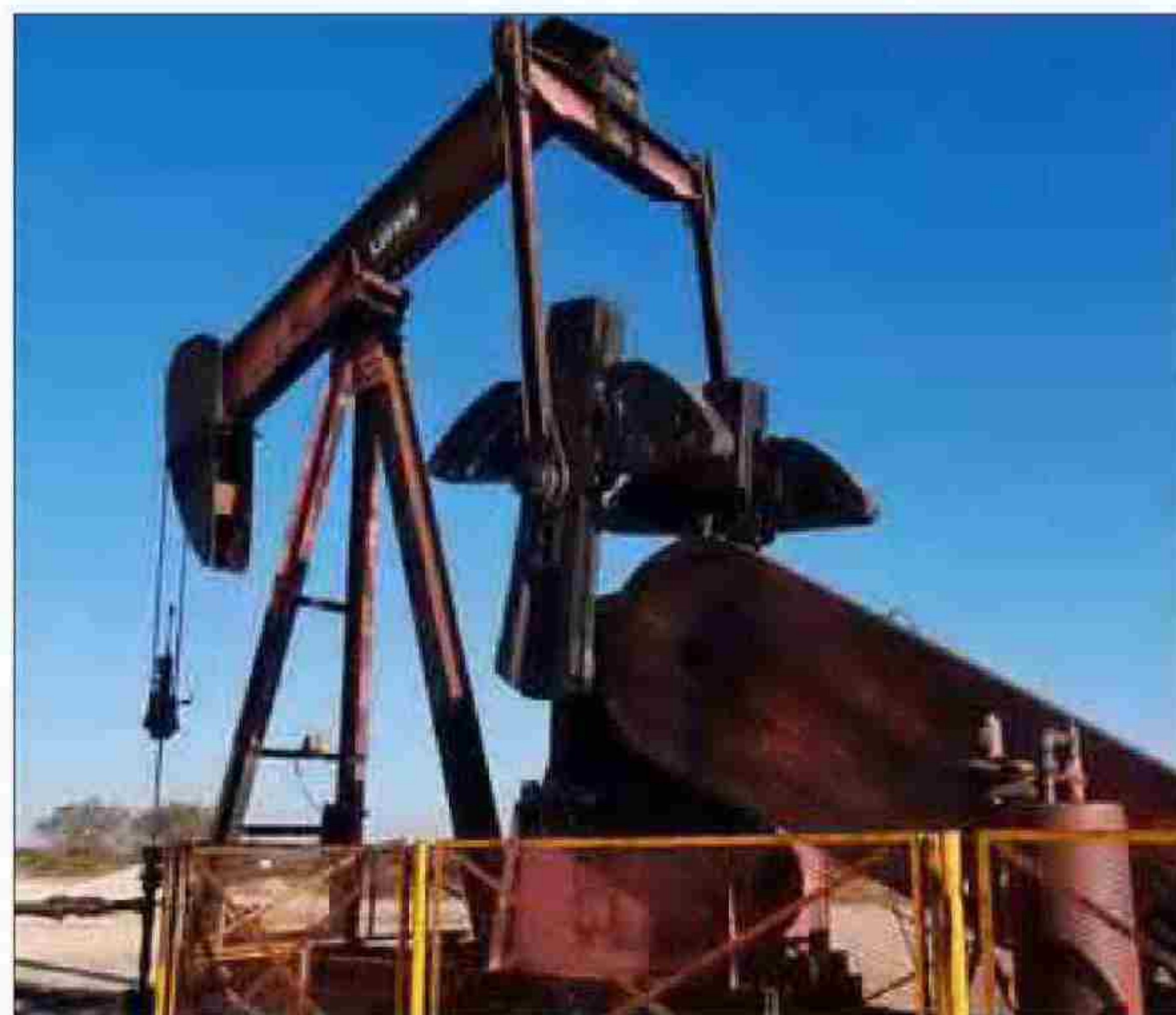
En Ayoluengo podemos visitar el campo petrolífero.