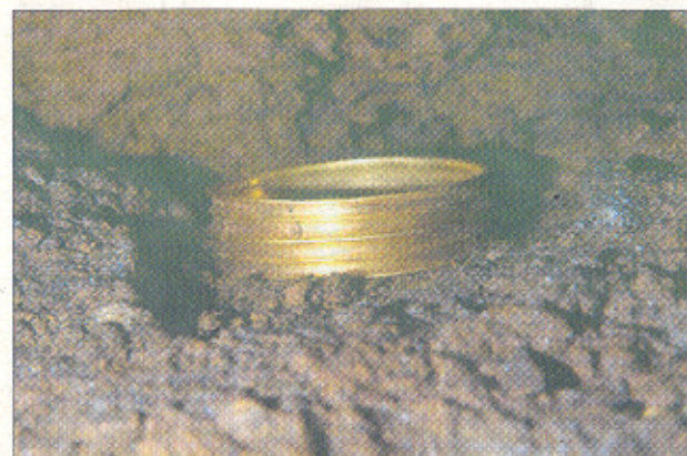
Brazalete localizado en las cuevas del Silo, Atapuerca.