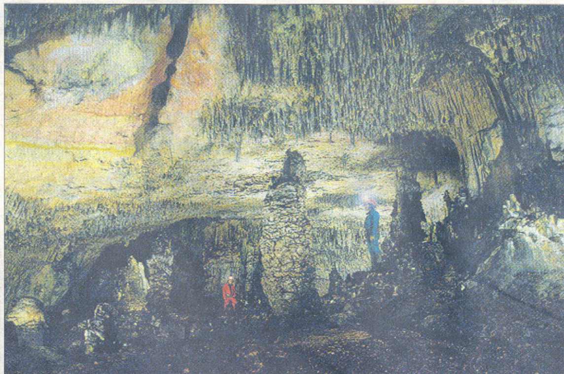
Galería de las Estatuas, gran cavidad que se encuentra bajo la sierra de Atapuerca y que fue localizada por Edelweiss.

la fundación del Grupo en 1951. Fue la primera agrupación espeleológica formada en Castilla y León y la más antigua. Además es de los más antiguos de España. «De aquellos grupos que se fundaron entonces es el