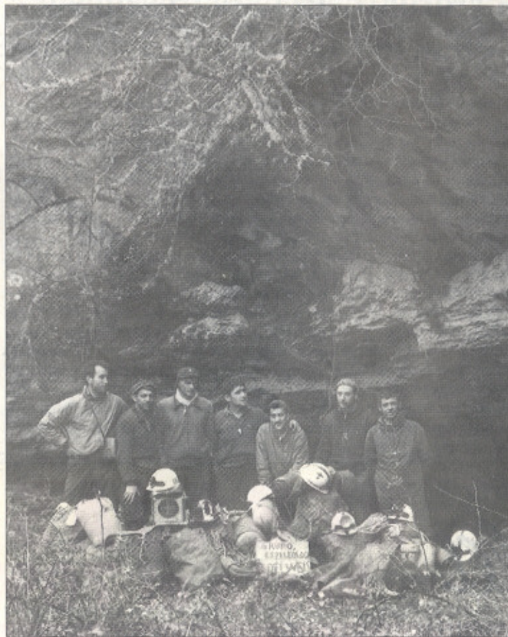
Imagen del primer grupo de Edelweiss en Atapuerca (1978).

La entrega se realizará en una fecha por determinar de 2011.