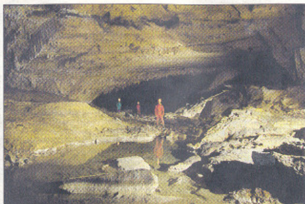
Interior del complejo de Ojo Guareña.