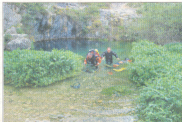
Dos espeleobuceadores salen del Pozo Azul de Covaleda.