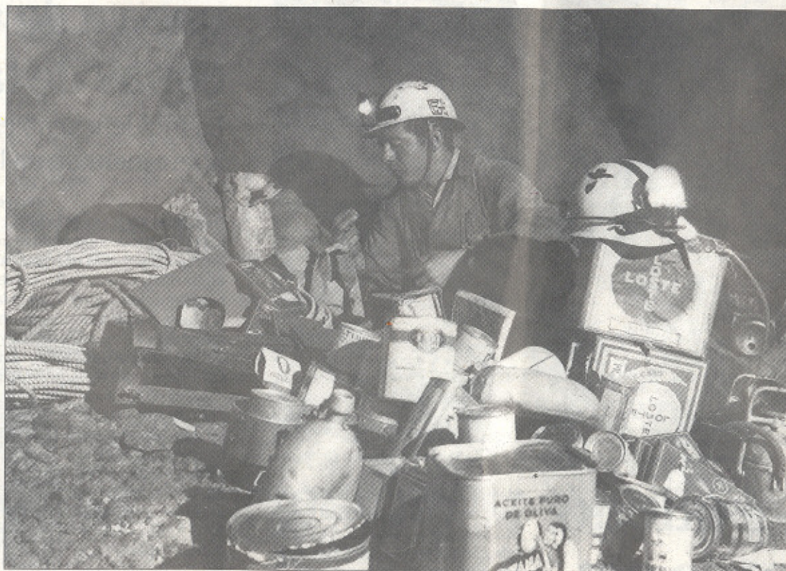
Las nuevas tecnologías han aligerado el equipaje respecto a los primeros espeleólogos.

Los nombres de estos cinco muchachos hoy abuelos, dos de ellos ya fallecidos, quizás no suenen al común de los burgaleses. Pero gra-