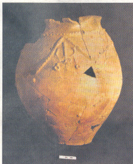
Vasija de la prehistoria reciente en Atapuerca.

para acceder a Atapuerca es necesaria una tarjeta de visitante, investigador o periodista, y a él se acercan casi 100.000 personas al año. Ahora la mirada de este grupo está puesta en otro lugar. Las cavidades de Juarros, las zonas próximas a Burgos, la localización de hasta 80 cavidades en la Sierra de Ubierna o las formaciones de cuevas en el área de Espinosa de los Monteros, son algunos de los puntos que centran su interés para futuras publicaciones.