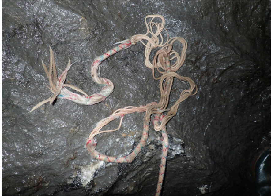
2014: efectos de la cascada en la cuerda, al pie del P 32 m.

casamente prometedora, después de unos pozos tan limpios.