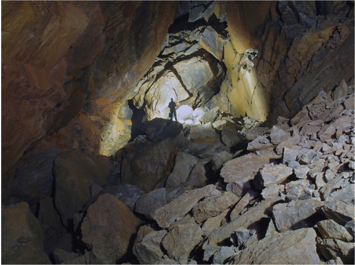
El Caos del Agorero.

cimiento probablemente estuvo relacionado con las espectaculares reexcavaciones que tuvieron lugar en algunas galerías de Ojo Guareña en aquellas mismas fechas; consultar la web del G.E.E.).