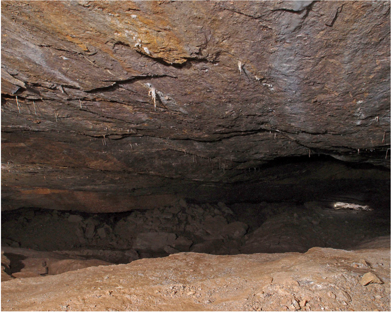
Vista parcial de la Sala del Ágora.

Llegar hasta allí abajo exige descender un rosario de pozos muy activos y obviamente limpios (¡cómo no iban a estarlo!), que requieren de una instalación bastante atlética para evitar cualquier contacto con el agua.