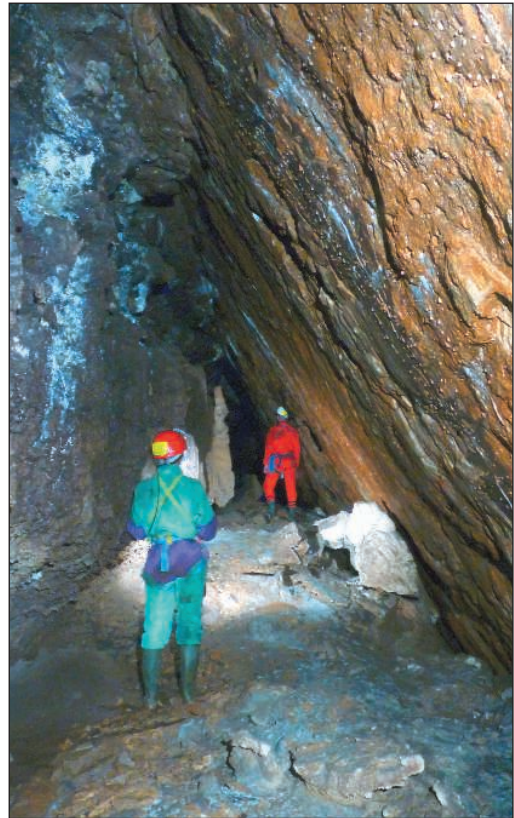
Galería Inferior.