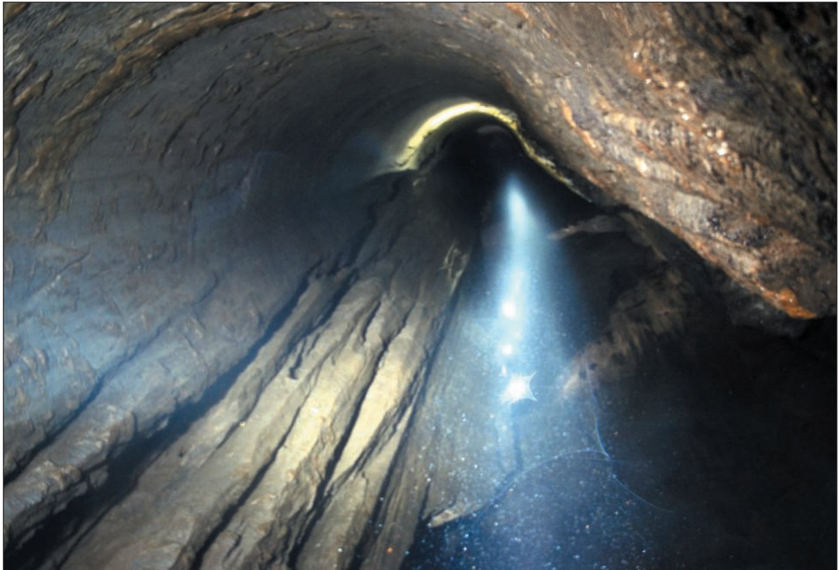
Aspecto del tramo intermedio, a 141 m de profundidad, del gran pozo de 202m. Las tres luces son los espeleólogos, separados por una distancia de 40m.