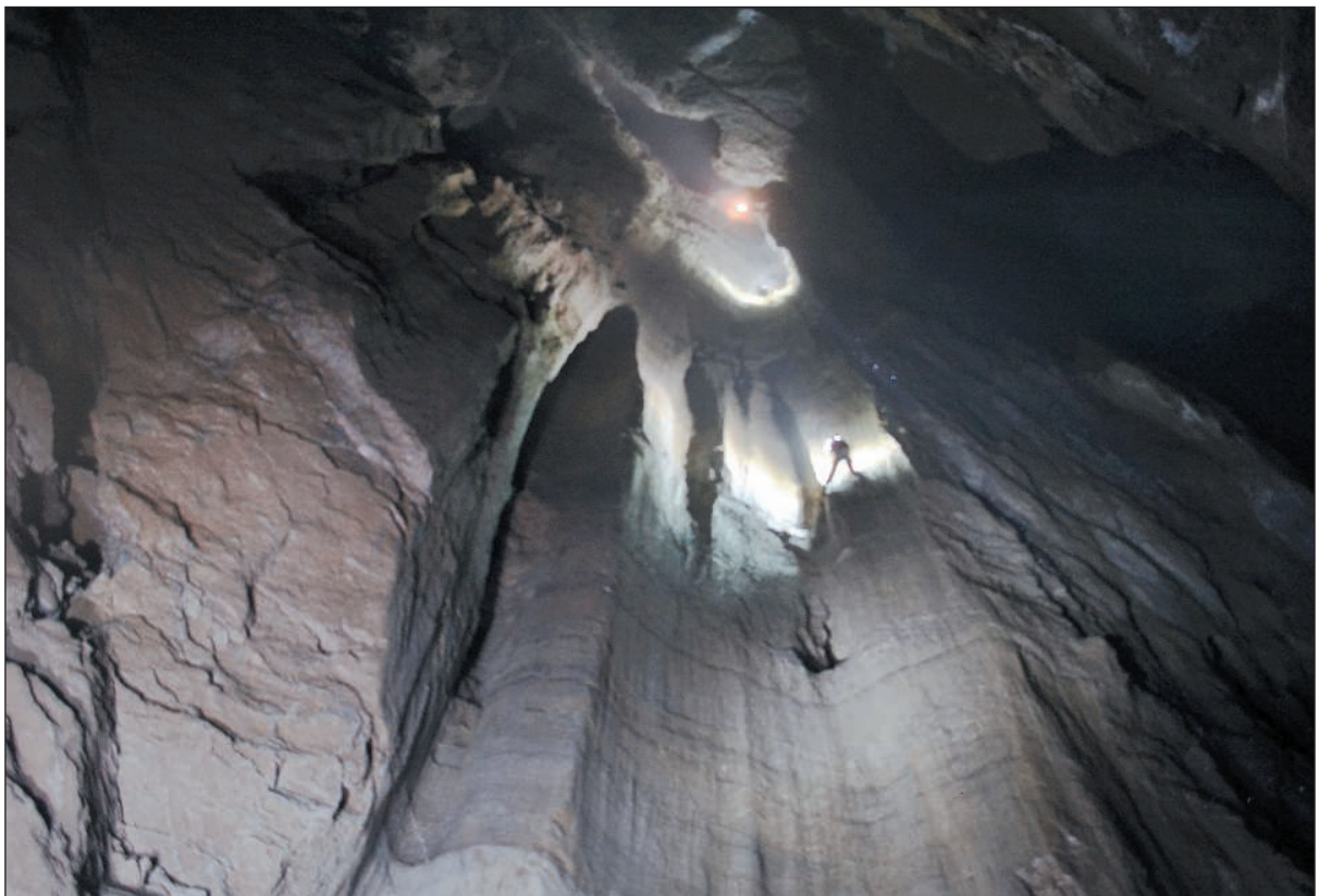
El tramo inicial del gran pozo de 202m, desde una repisa intermedia.