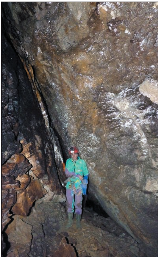
Acceso al pozo de 120m.