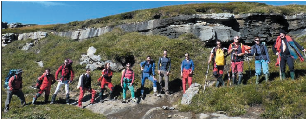
El grupo de exploradores en los primeros trabajos en la cavidad.

en la exploración de las numerosas repisas, ventanas, que posibilitan la conexión de los pozos, y que además puedan permitir la conexión con otras grandes cavidades del Castro Valnera.