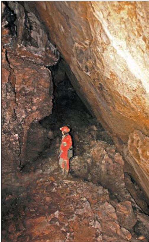
Galería Superior.