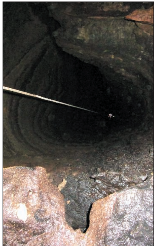
Cabecera y tramo de 85m del pozo de 120m.

Aspecto de los niveles superiores, en los que destaca el plano de falla, que determina tanto la forma de los conductos como el desarrollo de la cavidad y por el cual se profundiza hacia la sucesión de pozos.