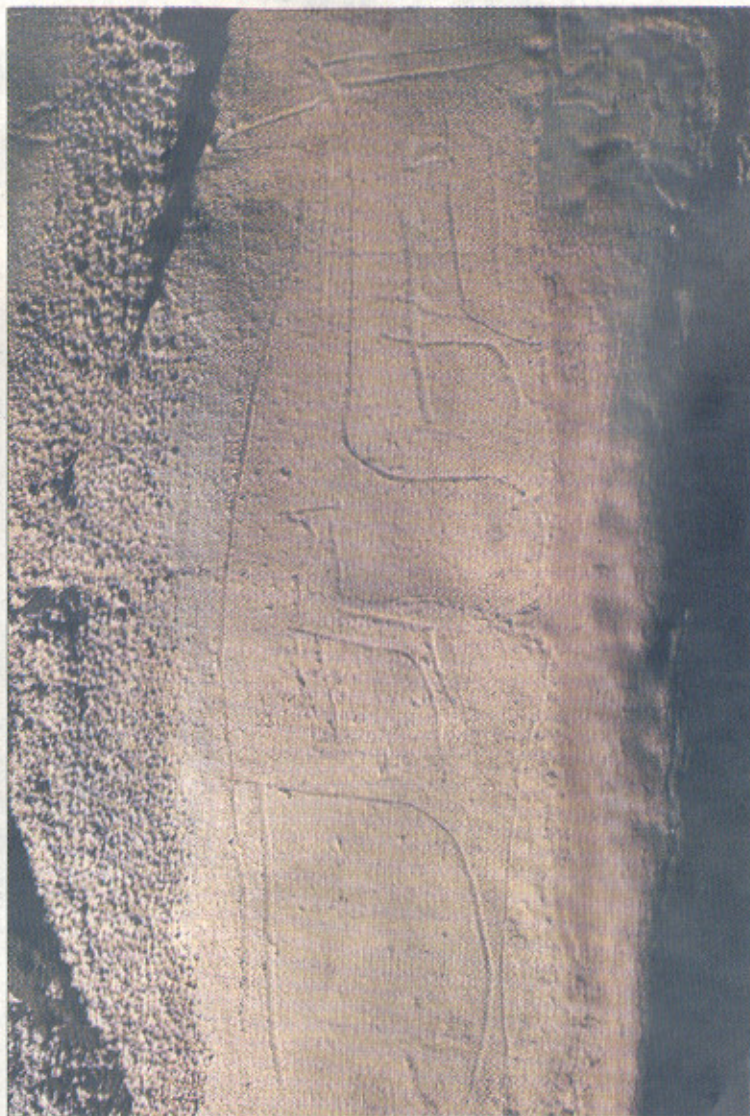
Grabado de una cierva con una cría, adoptado como logo de Edelweiss.

El estudio de información y datos geológicos previos ya ha arrancado. «Estamos en una fase inicial realizando una recopilación de análisis de biografía y disponiendo la descarga y procesado de cartografía digital existente», asegura Theodoros Karampanglidis. Esta información se