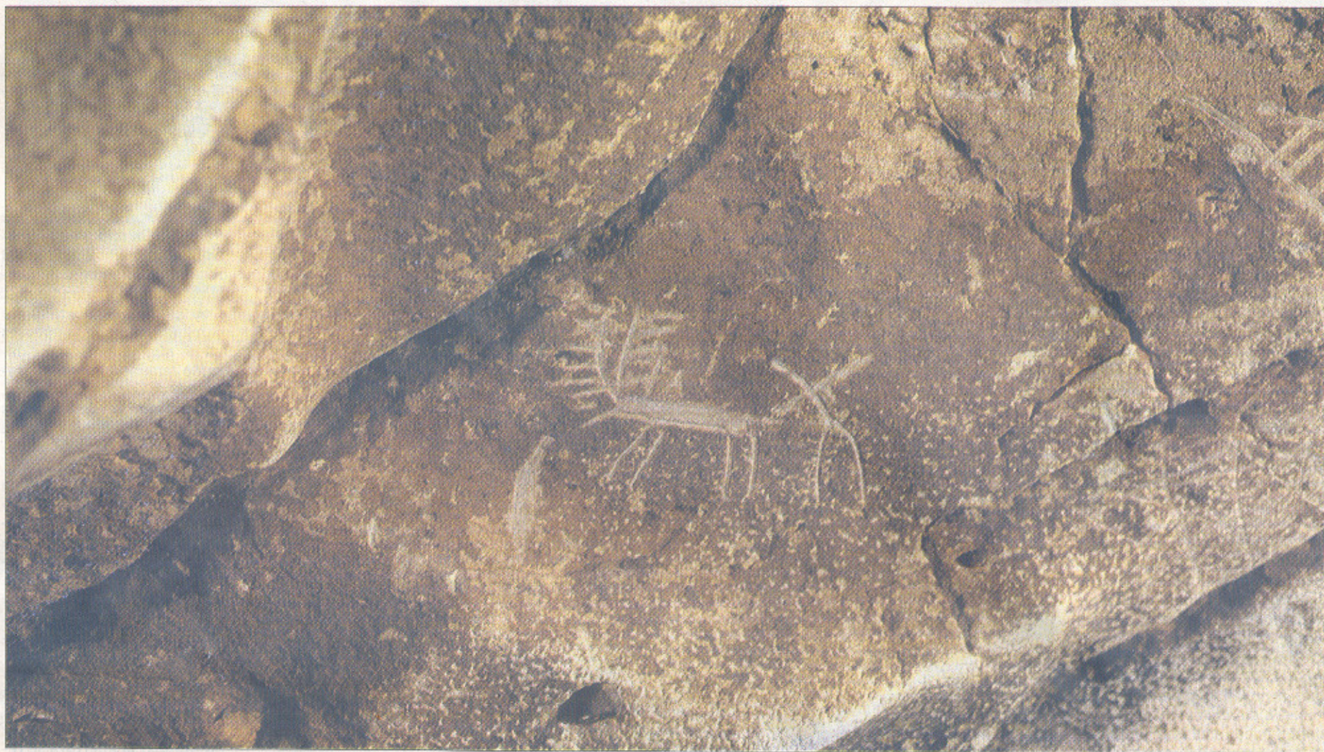
Grabado postpaleolítico esquemático de una escena con un ciervo y un antropomorfo. / MIGUEL ANGEL MARTÍN (FOTOS GRUPO ESPELEOLÓGICO EDELWEISS)

&gt; COMPLEJO OJO GUAREÑA / ¿Otro lugar clave en la evolución humana?