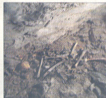
Inhumación de un individuo.

completará con la interpretación de la cartografía y la geomorfología del territorio. Después se realizará un trabajo de campo en las propias cuevas. De esta manera se pretende analizar la formación de la cueva en relación con la morfología del exterior. Este complejo kárstico, el más grande de España y uno de los más largos del mundo, tiene muchos niveles y, según los científicos, cada nivel está asociado a un fenómeno que sucedía en el exterior de las cuevas. «Cada uno de los niveles de Ojo Guareña, como sucede en todos los